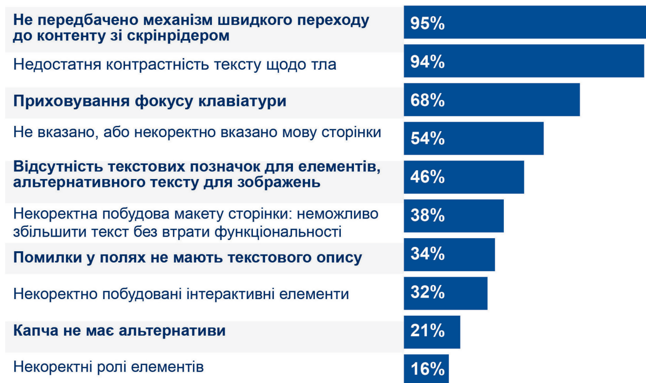
Графік 1. Перелік найбільш поширених критичних помилок доступності

За результатами дослідження було виявлено 10 найбільш поширених помилок, які є критичними для користування вебпорталом людьми з інвалідністю.